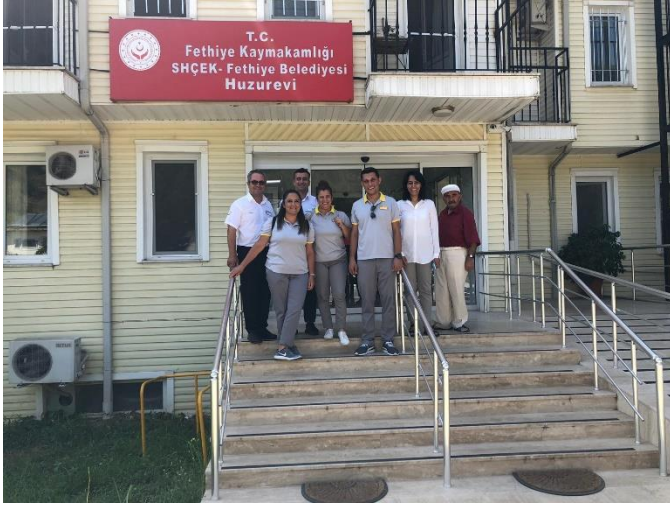
Visit to old people home and orphans' home