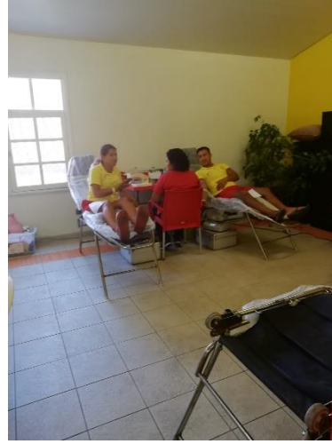
Blood Donation to Kızılay