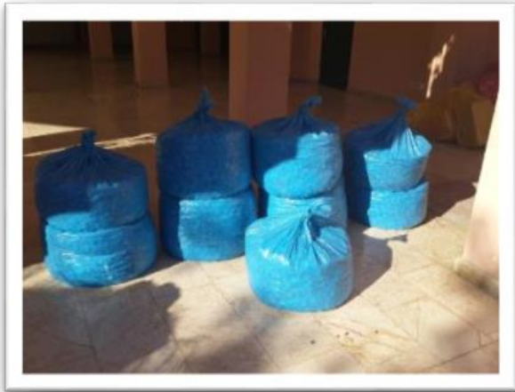
Collecting blue caps for wheelchairs.